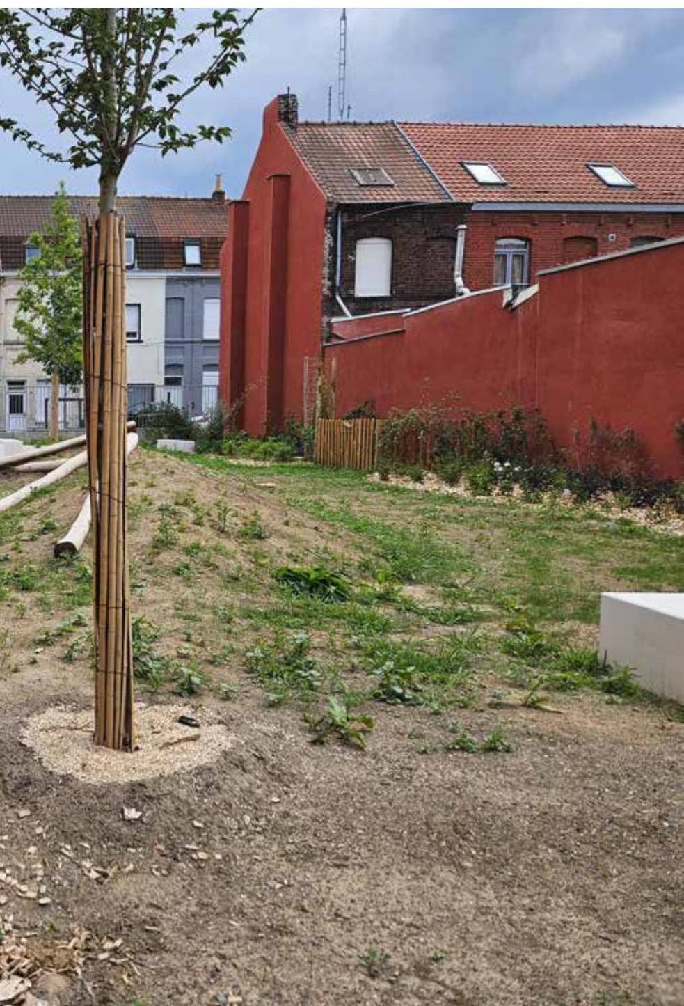
Jardin de proximité, PMRQAD Pile à Roubaix / Ymaë