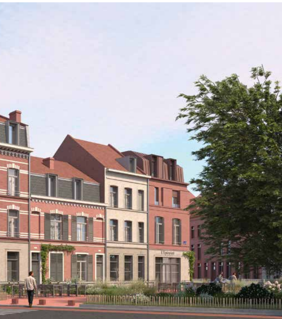
Perspective d'une réhabilitation sous MOA SPLA NPNRU Lille Quartiers Anciens