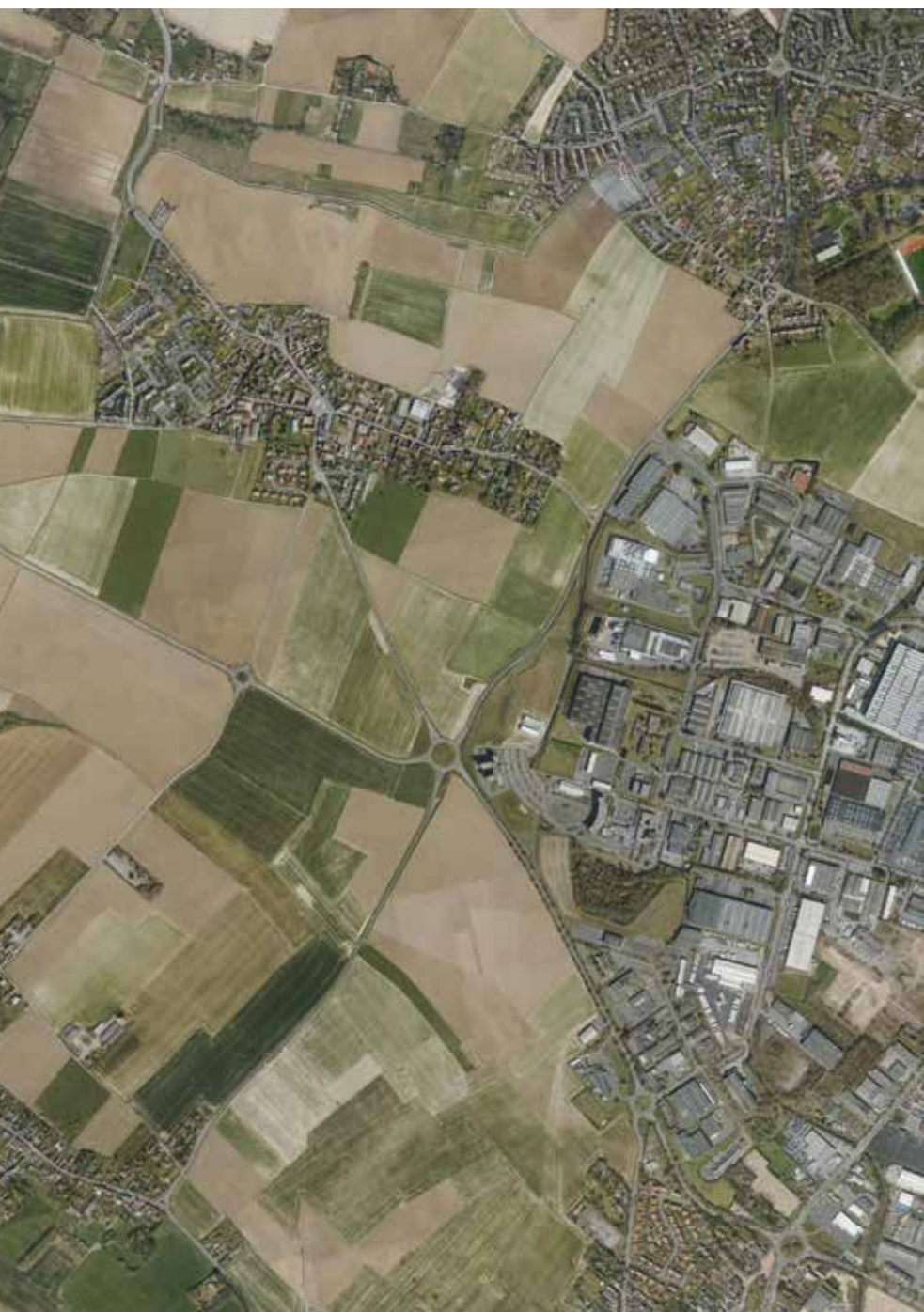
Vue aérienne de Noyelles-lès-Seclin et Houplin-Ancoisne, villes signataires de la charte gardiennes de l'eau