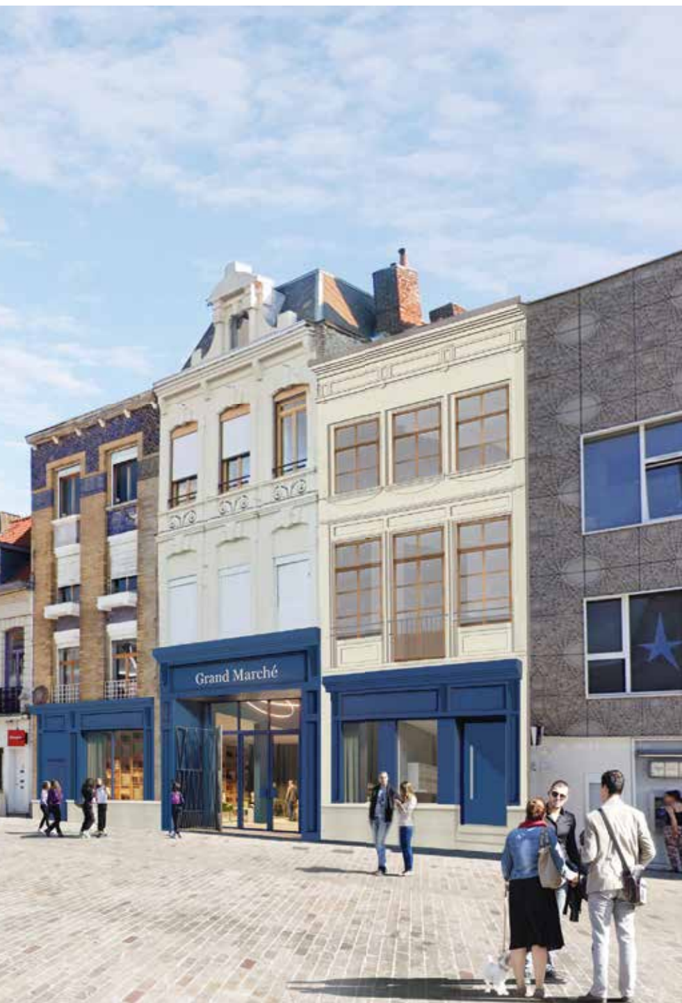
Perspective d'une réhabilitation sous MOA SPL, Tourcoing Centre-ville